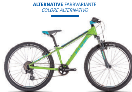
ALTERNATIVE FARBVARIANTE COLORE ALTERNATIVO