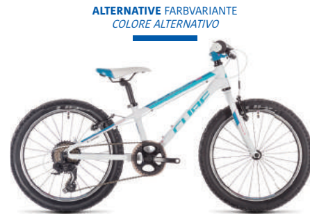
ALTERNATIVE FARBVARIANTE COLORE ALTERNATIVO